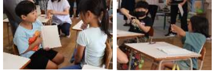
【自分の考えを友達に説明】

このように、「問い」をもつきっかけづくりが大切であり、その仕掛けの工夫も必要です。子どもの思考に寄り合いながら、よりよい授業になるよう授業後は職員で協議をし、授業改善に努めています。