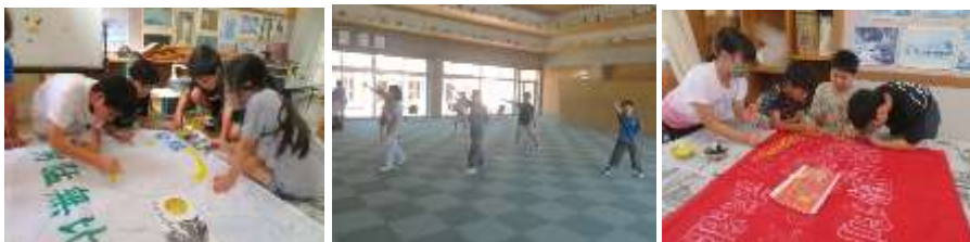
【応援団や旗の準備が進んでいます！】