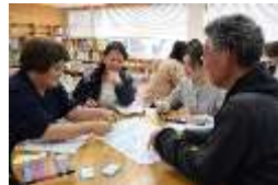
【重点目標のワークショップの様子】

下山田小は小規模校であるため、様々な事に対して支援が行き届くよさがあります。反面で、児童が受け身になりがちな点があります。そこで、今年度は自分の問いを立て、探り、新たな問いへとつながる「探究的な学び」がうまれる授業づくりや、共通の目標を達成しようと、互いを受容し共感するやりとりを行いながら、心地よさを感じ合える関係づくりを目指したいと思います。