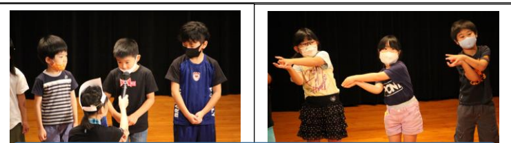
なかよくなるうね自己紹介 (1年生)