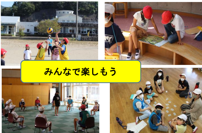
みんなで楽しもう