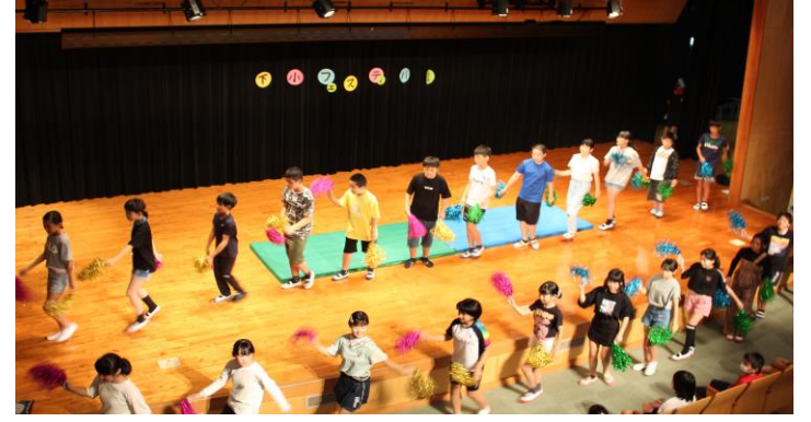
チアダン下山田! (6年生)